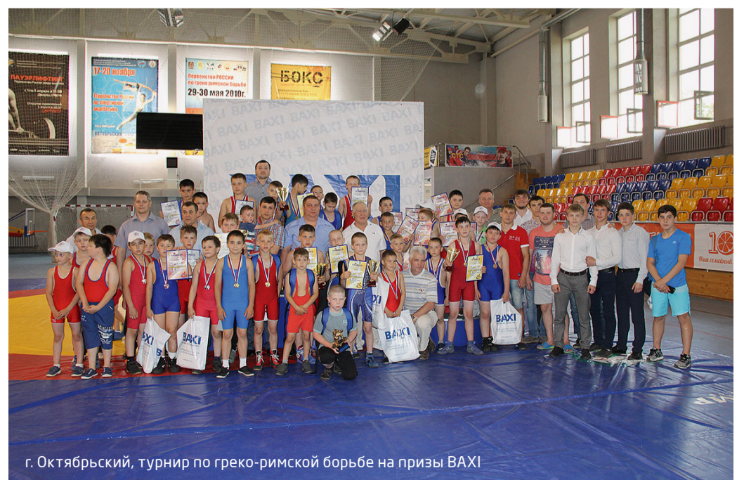
г. Октябрьский, турнир по греко-римской борьбе на призы BAXI