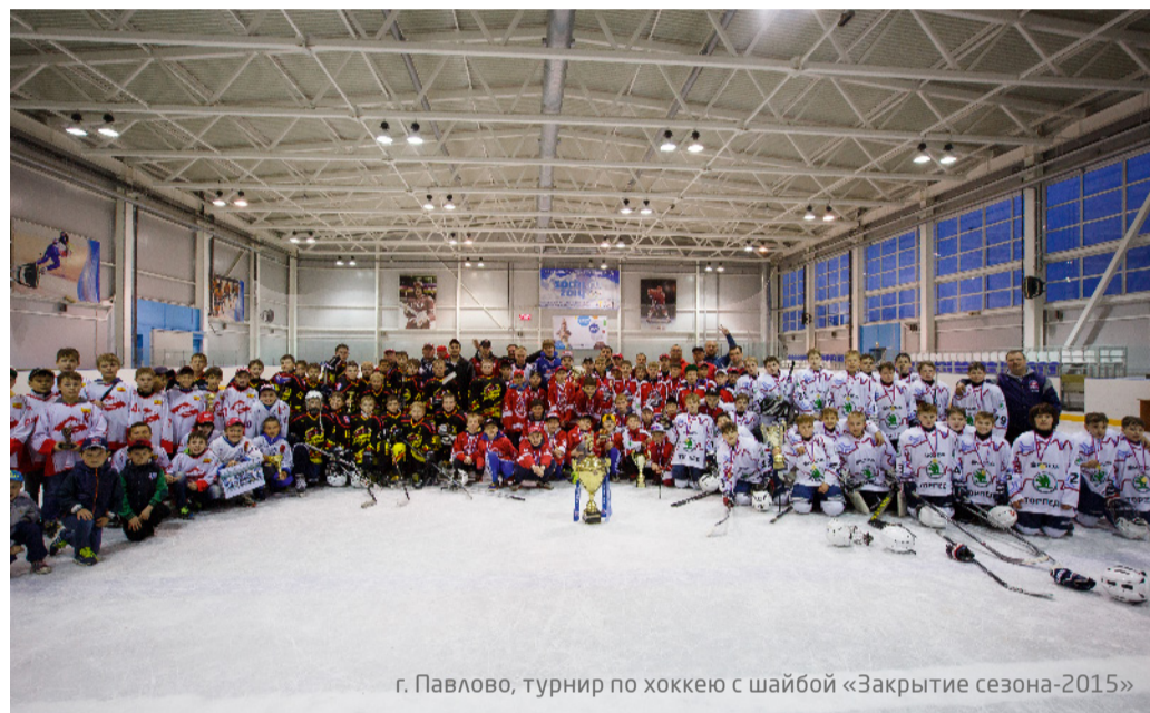
г. Павлово, турнир по хоккею с шайбой «Заккрытие сезона-2015»

■ Компания BAXI S.p.A. второй год подряд выступила спонсором Всероссийского турнира по хоккею с шайбой среди юношей 1999 г.р. Соревнования проводились на хок-